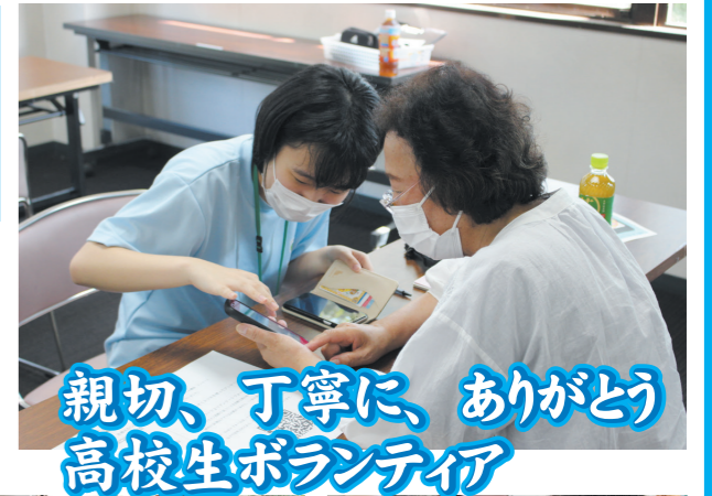
親切、丁寧に、ありがとう 高校生ボランティア

高校生ボランティアに協力いただき対面でのスマホ講座を開催。参加者の皆さんからは、「楽しく教えてもらいました」「丁寧でとても解りやすく良かった」などのお声をいただきました。